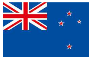
通貨: ニュージーランド・ドル